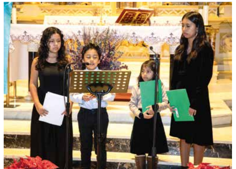
Dzieci z Parafii Św. Róży z Limy

Koncert zorganizowany był pro bono przy wsparciu darczyńców. ■