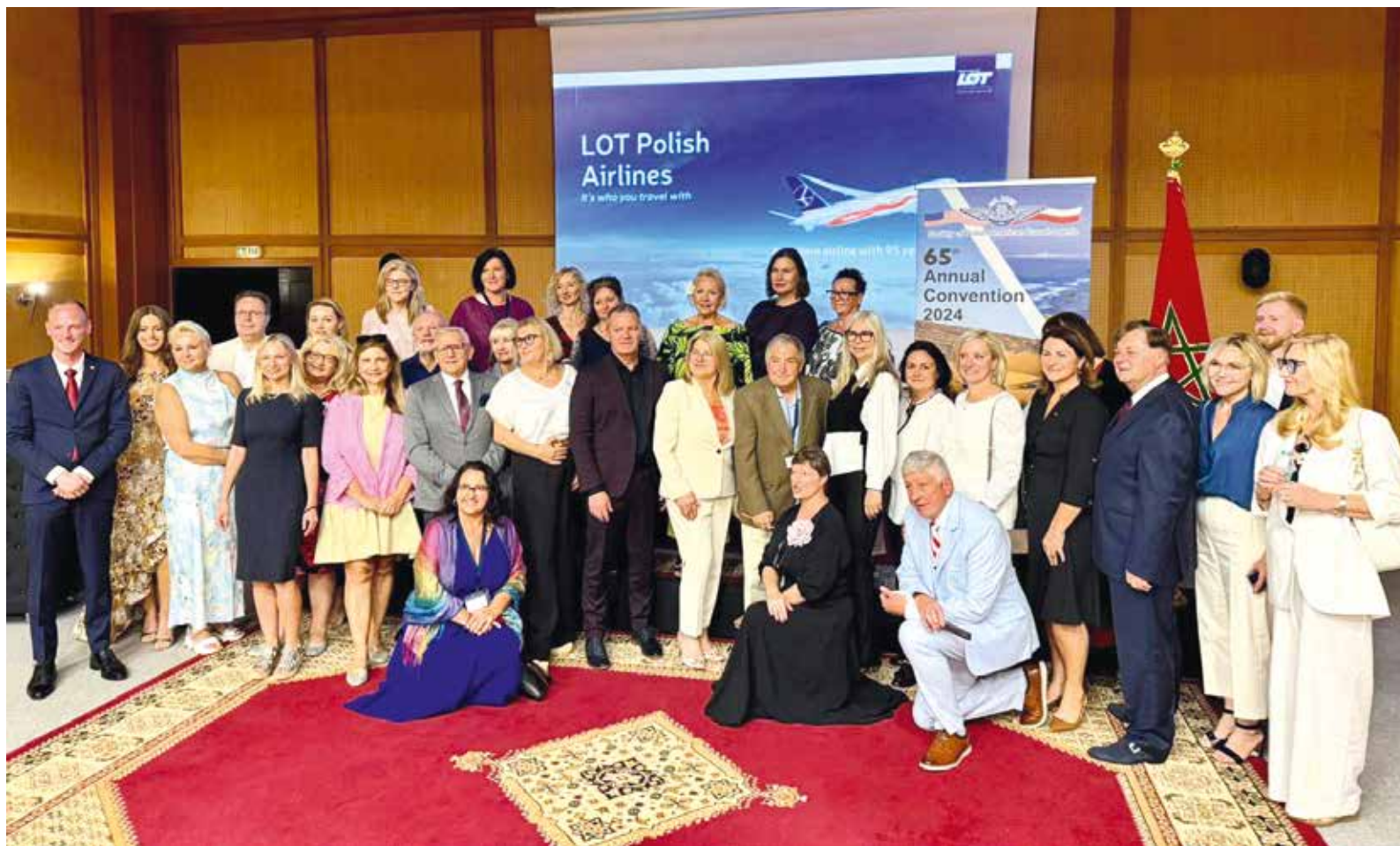
Konwencja SPATA w Maroku

ZAGRANICZNY OŚRODEK POLSKIEJ ORGANIZACJI TURYSTYCZNEJ (ZOPOT) ORAZ SOCIETY OF POLISH AMERICAN TRAVEL AGENTS (SPATA) ŁĄCZA SIŁY, ABY WSPÓLNIE PROMOWAĆ POLSKĘ WŚRÓD POLONII W STANACH ZJEDNOCZONYCH.