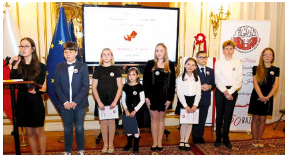
Uczniowie zaprezentowali okolicznościowy program artystyczny