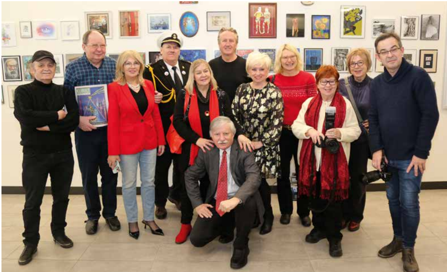
Pamiętkowe zdjęcie części osób biorących udział w wernisażu