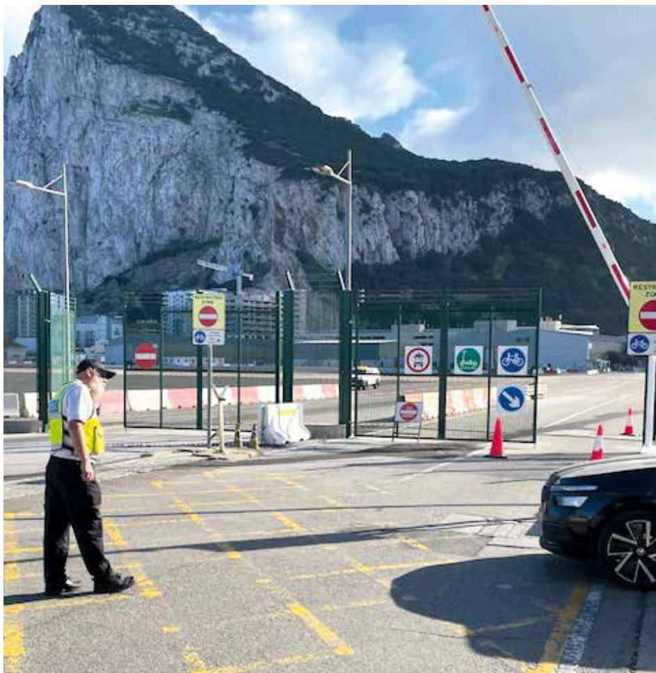
Skala Gibraltarska. Na pierwszym planie płyta startowa lotniska i granica

Skąd się tam wziąłem? Grupa przyjaciół-żeglarzy,