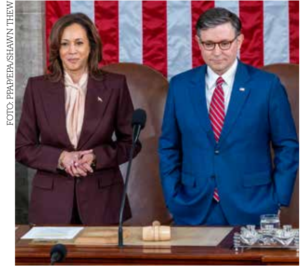
Ceremonii przewodniczyła wiceprezydent Kamala Harris, a towarzyszył jej spiker Izby Reprezentantów Mike Johnson

W wyborach prezydenckich w listopadzie 2024 roku Donald Trump uzyskał 77 303 573 głosy powszechne (49,91 proc. wszystkich oddanych), a jego kontrkandydatka Kamala Harris - 75 019 257 głosów powszechnych (48,43 proc. wszystkich).