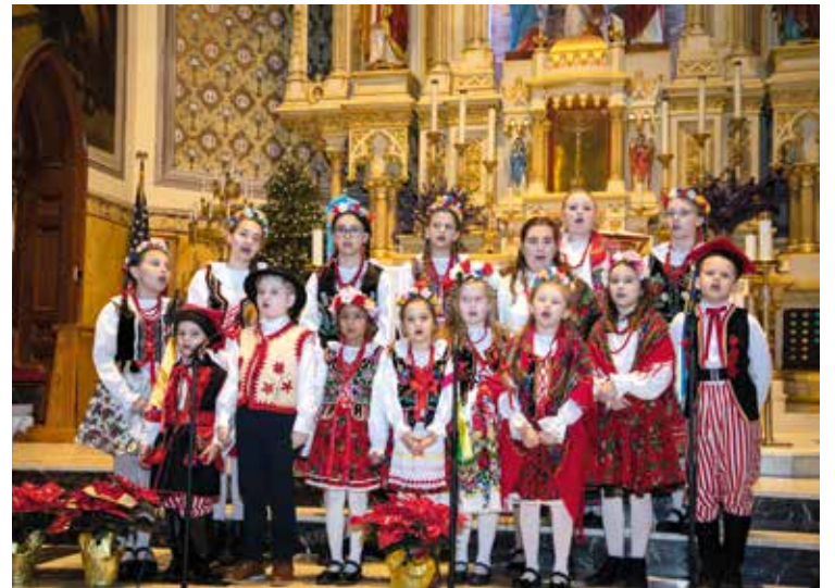
Krakowianki i Górale