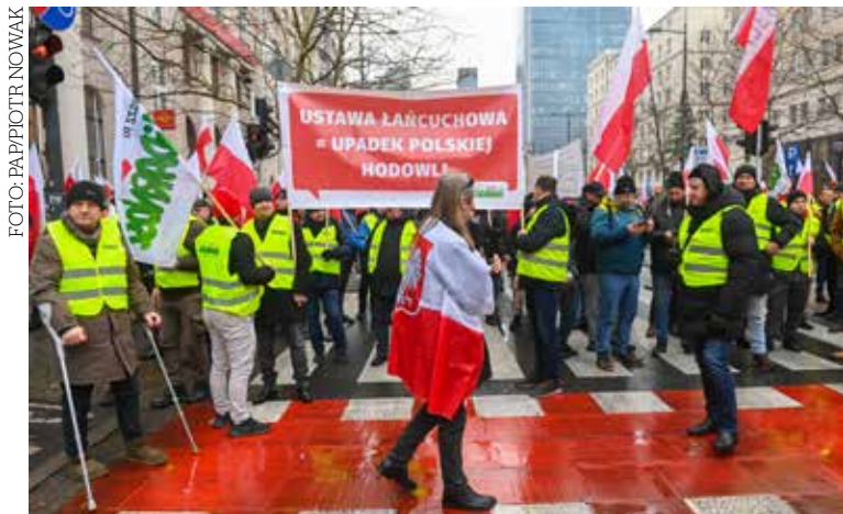
Rolnicy protestowali w Warszawie przeciwko przepisom i działaniom, które ich zdaniem szkodzą polskiemu rolnictwu

Wicepremier i szef PSL Władysław Kosiniak-Kamysz napisał na platformie X, że "Rząd z rolnikami mówi jednym głosem w sprawie umowy UE-Mercosur. Nasz wspólny sprzeciw jest jednoznaczny. Rozpoczynająca się prezydencja Polski w Radzie UE to okazja do tego, by ten głos wybrzmiał w Brukseli jeszcze