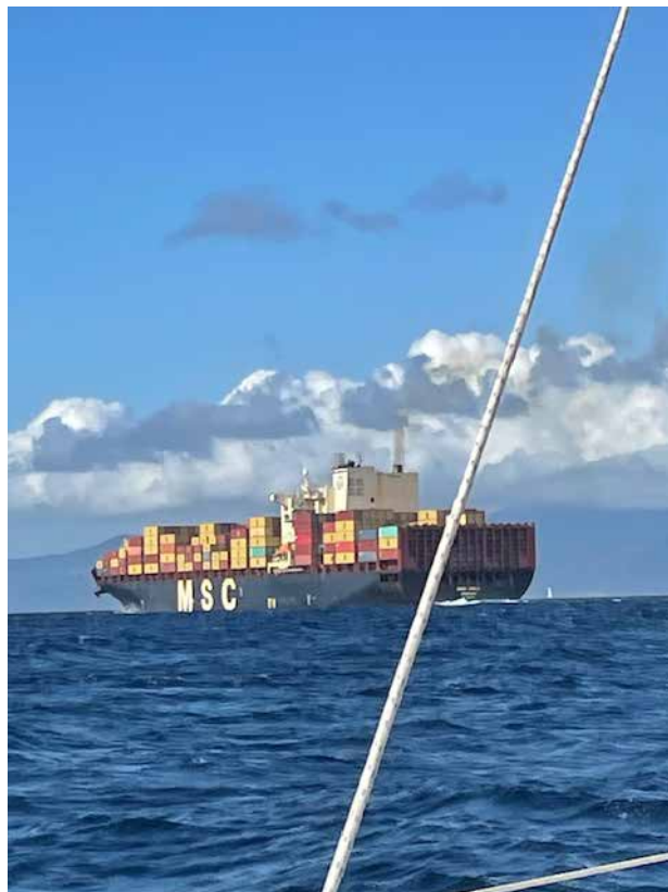
Przez Cieśninę Gibraltarską codziennie przepływa około 300 statków

Po kilkudniowych wjazdach po Cieśninie Gibraltarskiej i całodziennym pobycie w mieście Tetouan w Maroku, dokąd pieszo przeszliśmy granicę z hiszpańską Ceutą, leżącej w Afryce, wreszcie nadszedł czas na zwiedzanie Gibraltaru. Jak na tak mały obszar jest tu co oglądać. Jednak nie ma potrzeby, żeby na to poświęcać więcej, niż jeden dzień. Przeszliśmy wspomniany na początku pas startowy, który zamykany jest na czas startu lub lądowania samolotów, ale takiej operacji każdego dnia jest mniej