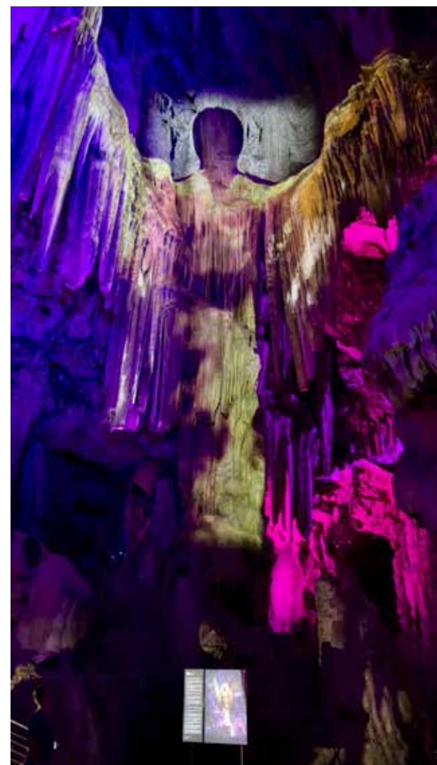
W Jaskini Św. Michała organizowane są koncerty muzyki klasycznej

ki i blokami oraz port z ładunkowymi suwnicami. Przy niektórych cumowały statki, inne były wolne. Przy nabrzeżu cumował także wycieczkowiec. Po około dwóch godzinach pływania i zatoczeniu półkola, odpłynęliśmy bliżej środka Cieśniny. Tu co jakiś czas z wody wyska-