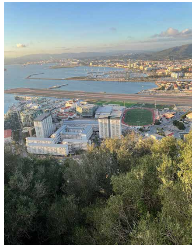
Na Gibraltarze wykorzystany jest każdy skrawek ziemi. Widok na zachodnie wybrzeże. Za pasem lotniska rozciąga się Hiszpania

Żegnaliśmy Gibraltar, gdy było już ciemno. Do granicy zmierzali tłumy ludzi, w większości Hiszpanów, powracających z pracy do domu. Codziennie rano około 18 tys. z nich przechodzi pas lotniska w stronę cypla, a wieczorem wraca. Dla nich zarobki u sąsiada są wyższe, niż u siebie, dla Gibraltarczyków zatrudnianie Hiszpanów wiąże się z oszczędzaniem na ich pensjach. Myśleliśmy, że opuszczamy ten skrawek ziemi na dobre, ale następnego dnia z powodu sztormowej pogody i niemożliwości pływania żagłówką, wybraliśmy się tam jeszcze raz. Poszliśmy w kierunku wschodnim, gdzie