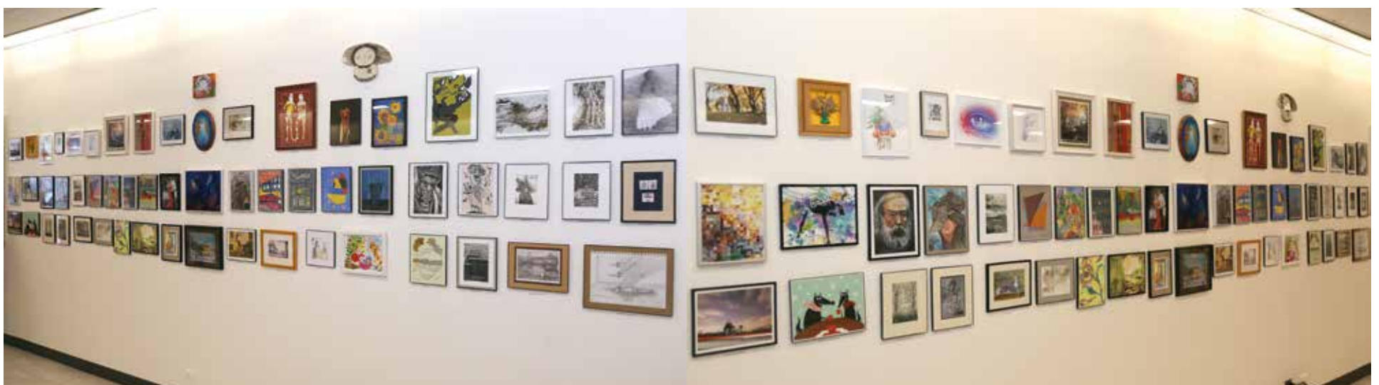
Ekspozycja "Together in Art" stanowi wielobarwny kolaż