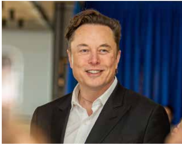
Elon Musk w ostatnim czasie jest mocno zaangażowany w europejskie sprawy polityczne

"Jest to szczególnie niepokojące, biorąc pod uwagę (fakt), że jego komentarze - atakujące przywódców kluczowych państw europejskich, które historycznie były sojusznikami USA - można uznać za reprezentujące poglądy nowe-