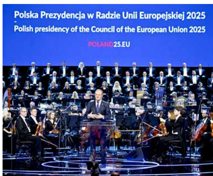
Przez najbliższe sześć miesięcy Polska będzie przewodziła działaniom Rady Unii Europejskiej

"To są wszystko źródła naszej siły. Jeśli Europa będzie bezsilna, nie przetrwa" - oświadczył Tusk. Premier zapowiedział też, że 21 stycznia wystąpi przed Parlamentem Europejskim, aby "powiedzieć o ambitnych zamiarach Unii Europejskiej, całej Europy i polskiej prezydencji na te bardzo trudne sześć miesięcy". Odnosząc się do wielkich oczekiwań Europy wobec polskiej prezydencji, Tusk skierował