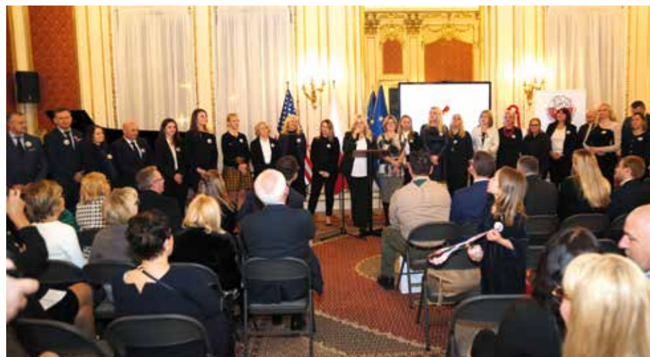
Uroczystość była okazją do przedstawienia Grona Pedagogicznego i Rady Rodziców