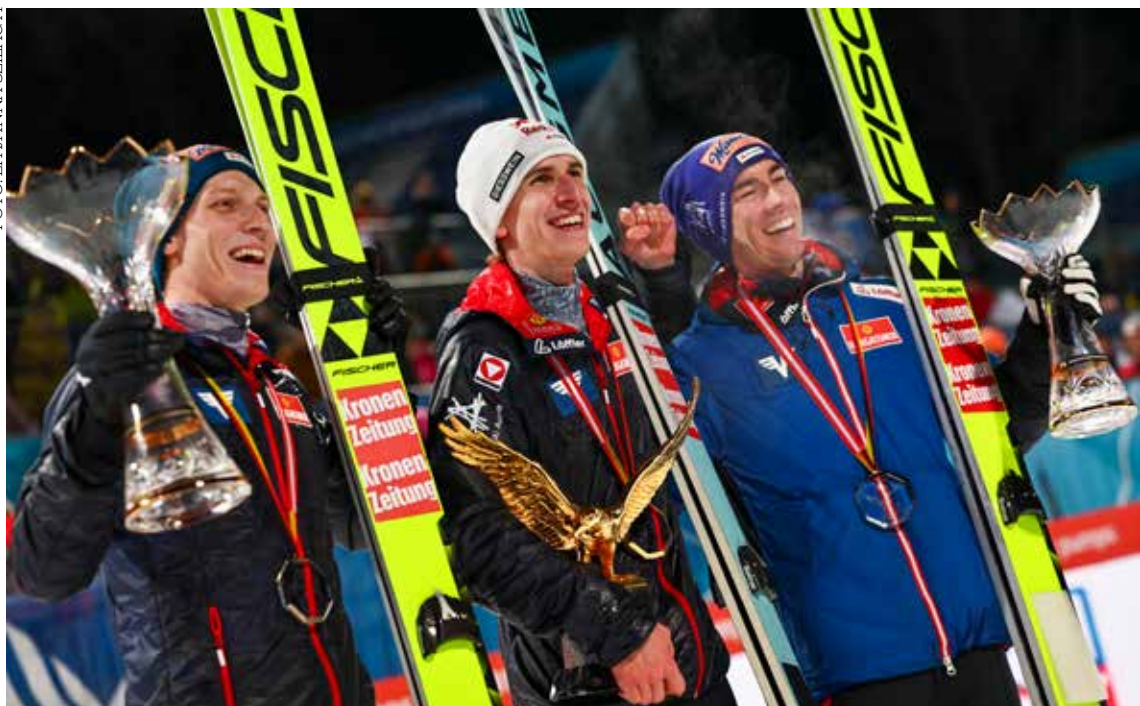
Najlepsi skoczkowie 73. Turnieju Czterech Skoczni. Daniel Tschofenig (w środku) w towarzystwie swoich rodaków Jana Hoerla (z lewej) i Stefana Krafta

do Dawida Kubackiego. Najlepszy z Polaków Paweł Wąsek zajął 16. miejsce, wygrywając w parze z Japończykiem Naokim Nakamura. Na 29. pozycji został sklasyfikowany Piotr Żyła.