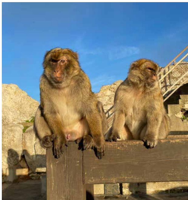
Małpy magoty, zamieszkujące szczytowe połacie Skały Gibraltarskiej, są jedynymi w Europie żyjącymi na wolności

kiwały delfiny i podplwały do naszej łodzi. To przecinały nam szlak, to płynęły tuż jednej albo drugiej burty. Wyglądało na to, że zjawily się, żeby dać nam przedstawienie. Zdażyliśmy uwiecznić ich popisy na telefonach komórkowych i wkrótce nam zniknęły. Gdy spokojnie sobie pływaliśmy, zachlystując się pięknem natury, nie mogłem przejść do porządku dziennego, że nie zgłębiłem wcześniej swojej wiedzy o tym zakątku świata, choć intrygował mnie od dzieciństwa. Wycią-