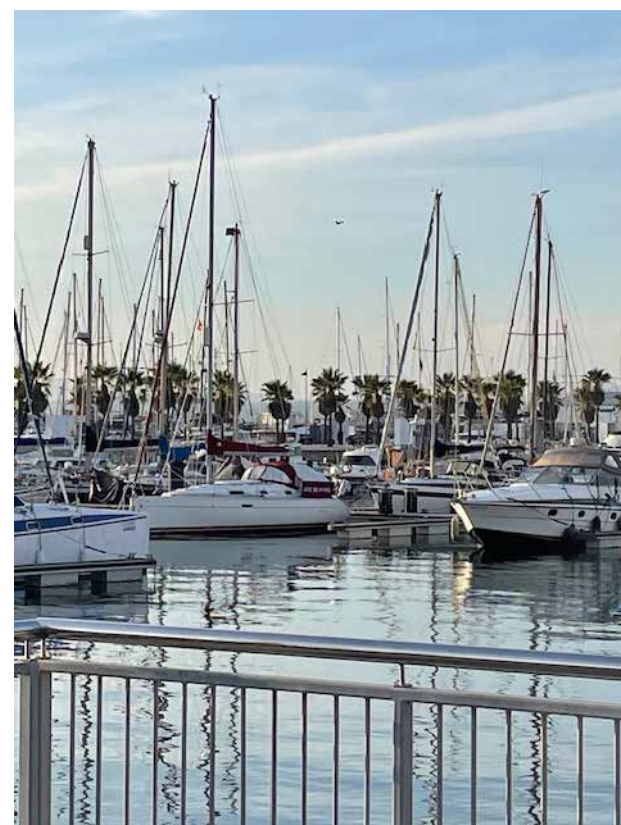
Alcadeisa Marina tuż przy granicy z Gibraltarem, gdzie wypożyczyliśmy żagłówkę

jest kilka pięknych plaż - Catalina i Sandy. Jak było do przewidzenia, nie było tam prawie nikogo, z wyjątkiem kilku mieszkańców wyprowadzających swoje psy. Godzinami wałęsaliśmy się wąskimi uliczkami i Main Street, przy której znajduje się Katedra Najświętszej Maryi Panny Królowej, której budowę ukończono w 1462 roku. Zaczekaliśmy do wieczora, gdyż chcieliśmy oglądać mecz reprezentacji Anglii w Lidze Narodów, która mierzyła się z Grecją. Nie tyle interesowało nas samo spotkanie, co atmosfera w barze, gdzie mieli gro-