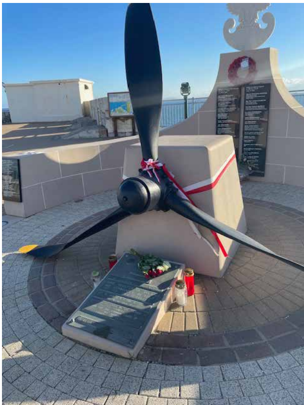
Pomnik upamiętniający katastrofę lotniczą, w której zginął generał Władysław Sikorski

gnąłem z plecaka tabletki i wchłaniałem ciekawostki z nim związane. Chciałem się dowiedzieć, jak wielki tu panuje tłok, bowiem co chwilę na horyzoncie pojawiały się statki. Okazało się, że średnio dziennie Cieśniną przepływa ponad trzysta dużych i małych jednostek. W najgłębszym miejscu akwen ten sięga nawet tysiąca metrów, ale przeważnie ma głębokość trzystu metrów. Od brzegu Gibraltaru do Afryki jest 20 km, gdzie wybieraliśmy się następnego dnia. Nie mogliśmy tam płynąć wcześniej, bo w marinie w Ceucie nie było wolnych miejsc.